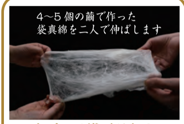
4~5個の繭で作った袋真綿を二人で伸ばします

店内で袋真綿の手挽きをして、1枚300~1500回重ねる職人の伝統技を体験しましょう