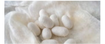
高級品は国産の玉繭を使用熱処理をしない高品質品もあります

店内で袋真綿の手挽きをして、1枚300~1500回重ねる職人の伝統技を体験しましょう